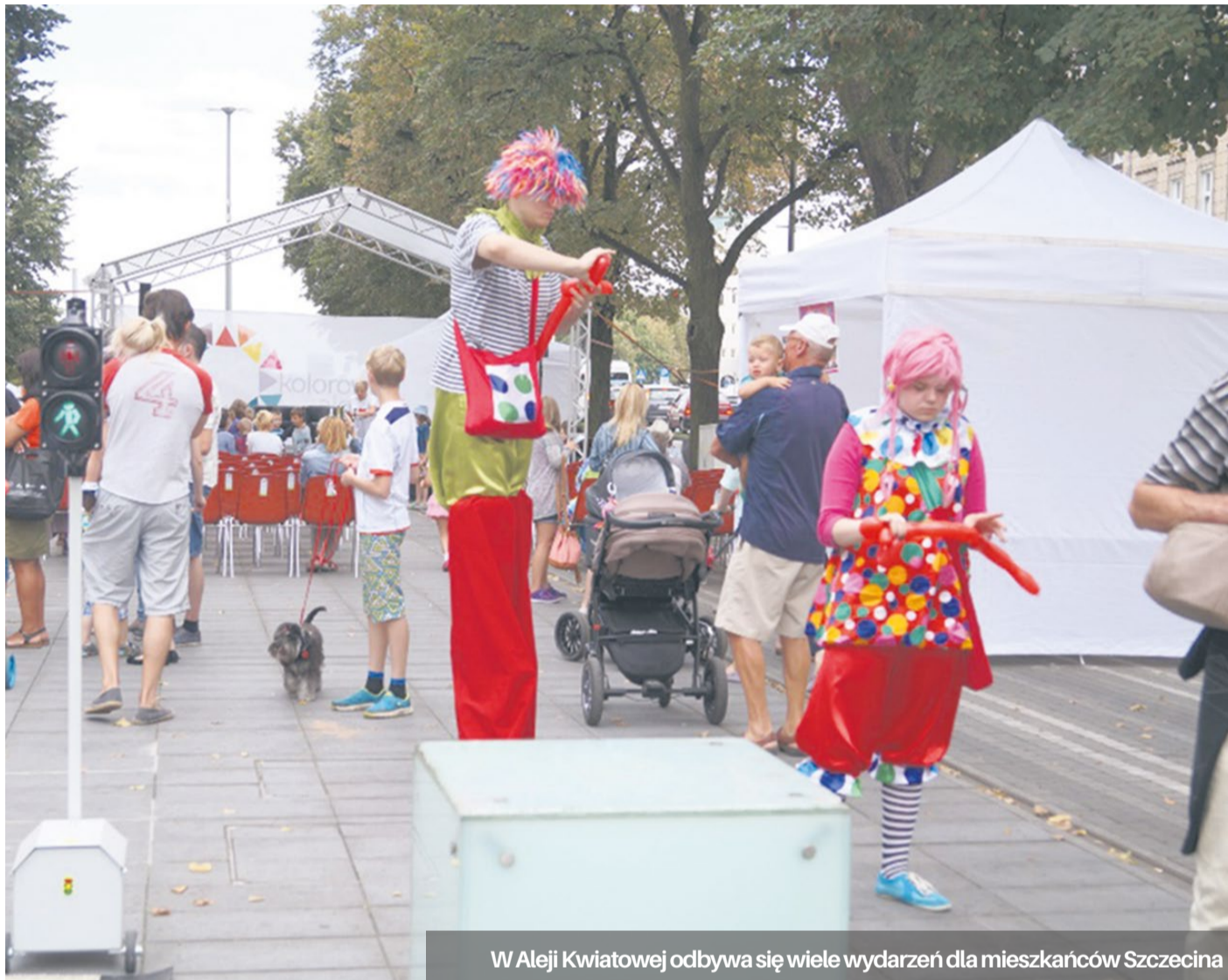
W Alei Kwiatowej odbywa się wiele wydarzeń dla mieszkańców Szczecina

Nie zabraknie również smakołyków w postaci popcornu, gofrów, waty cukrowej i kukurzy.