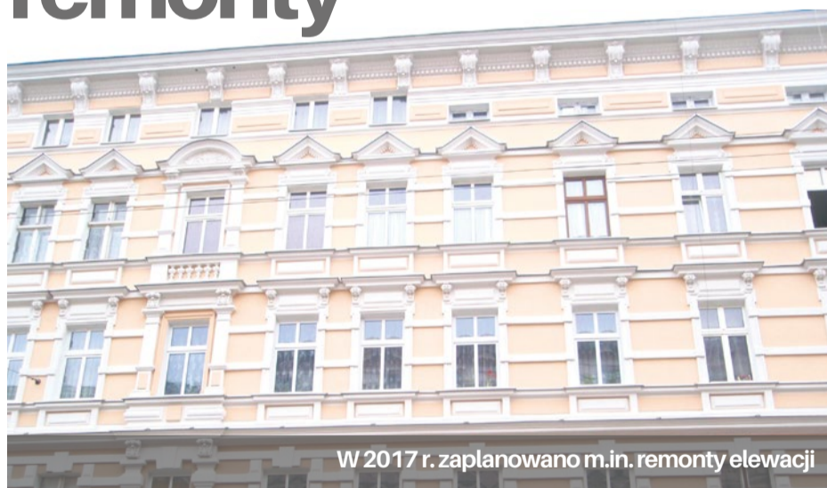
W 2017 r. zaplanowano m.in. remonty elewacji

13 mln zł na remonty w budynkach wspólnot mieszkaniowych.