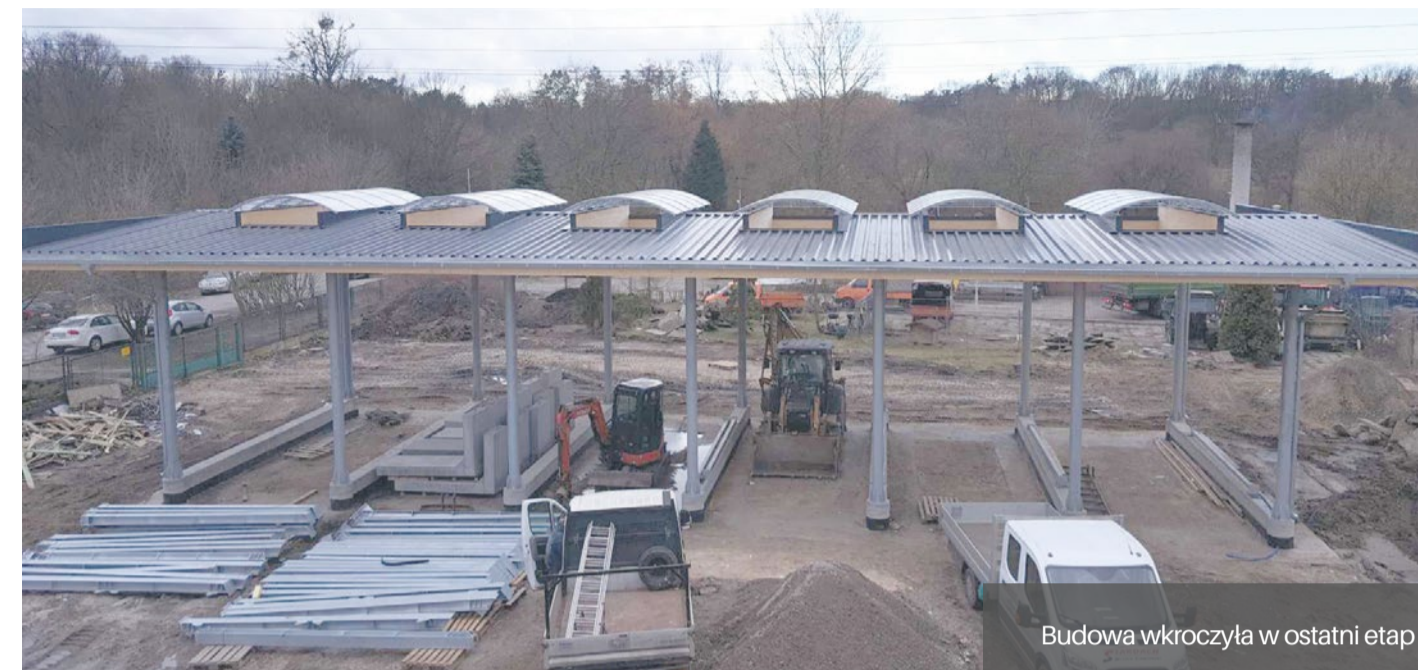
Budowa wkroczyła w ostatni etap