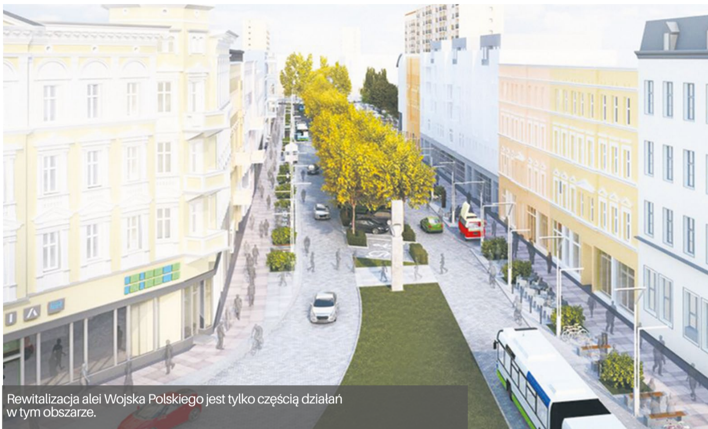
Rewitalizacja alei Wojska Polskiego jest tylko częścią działań w tym obszarze.

– Autobus elektryczny będzie kompromisowym rozwiązaniem w tym kwartale jako z jednej strony ekologiczny i nieemisyjny środek transportu publicznego, odpowiadający na potrzeby mieszkańców dotychczas transportu zbiorowego, z drugiej