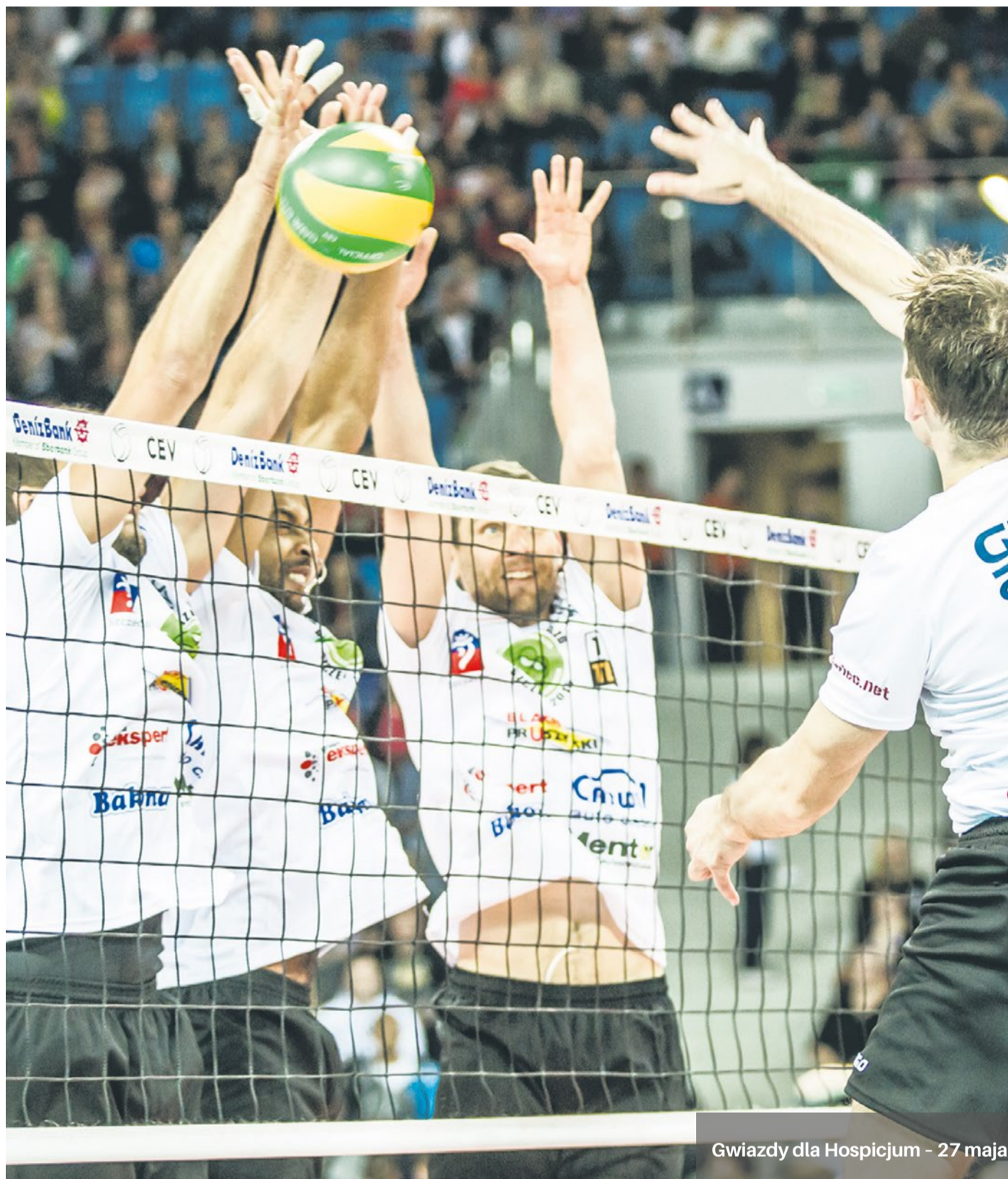
Gwiazdy dla Hospicjum - 27 maja

Gwiazdą Święta Uniwersytetu Szczecińskiego będzie Zespół Raz Dwa Trzy , który wystąpi w Filharmonii ( 23 maja o godz.