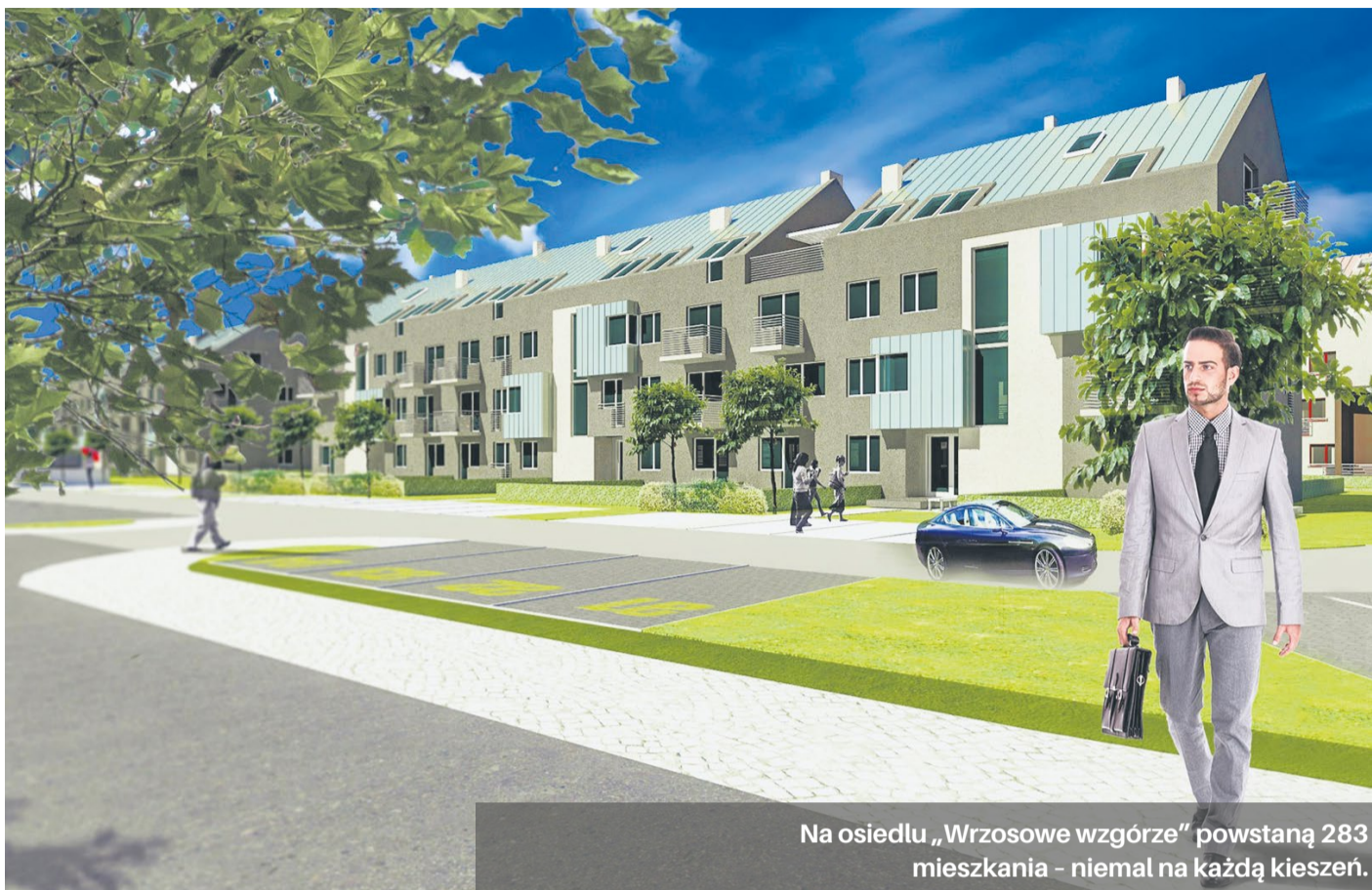
Na osiedlu „Wrzosowe Wzgórze” powstaną 283 mieszkania – niemal na każdą kieszeń.

Mieszkanie w partycypacji, to propozycja dla osób o średniej wysokości miesięcznych dochodów, które nie mają na terenie gminy innego mieszkania czy domu. Szacunkowa wysokość udziału w kosztach budowy mieszkania na Osiedlu „Wrzosowe Wzgórze” wynosi jedynie 1 200 zł za 1 m 2 powierzchni użytkowej.