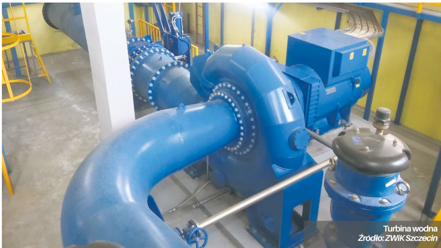
Turbina wodna

Ok. 17 proc energii elektrycznej potrzebnej do prowadzenie działalności ZWiK pozyskuje z OZE. Korzysta w tym celu z farm fotowoltanicznych a także biogazu powstałego w procesie oczyszczania ścieków. Dzięki zastosowanym rozwiązaniom Spółka racjonalizuje koszty energii. To m.in. pozwala na utrzymanie opłat za wodę i odbiór ścieków na niezmiennym od trzech lat poziomie. W planach ZWiK jest realizacja kolejnych inwestycji w OZE. W Pilchowie powstanie następna farma słoneczna. W zakładzie produkcji wody na Pomorzanach wybudowana zostanie z kolei wspomniana elektrownia wodna. Elektrownie wodne powstają na specjalnie w tym celu spiętrzonych rzekach. ZWiK nie będzie oczywiście budować tamy. Inwestycja zaplanowana przez Spółkę będzie mniej spektakularna, lecz jednocześnie bardzo oryginalna. Turbina wraz z generatorem umieszczona zostanie w rurze dostarczającej wodę z ujęcia na jeziorze Miedwie. Ponieważ różnica poziomów pomiędzy Miedwem a zakładem przy ul. Szczawiowej wynosi przeszło 30 metrów, elektrownia będzie produkowała energię wykorzystując spadek grawitacyjny wody w rurociągu. Elektrownia wodna zostanie wyposażona w turbinę wodną Francisa, o mocy zainstalowanej do ok. 140 kW. oraz pozostałe wyposażenie mechaniczne i elektryczne. Elektrownia będzie pracować jako elektrownia przepływowa przez całą dobę.