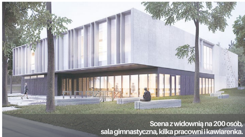
Scena z widownią na 200 osób, sala gimnastyczna, kilka pracowni i kawiarenka.

Rozstrzygnięto konkurs na koncepcję urbanistyczno-architektoniczną Centrum Aktywności Lokalnej w Podjuchach.